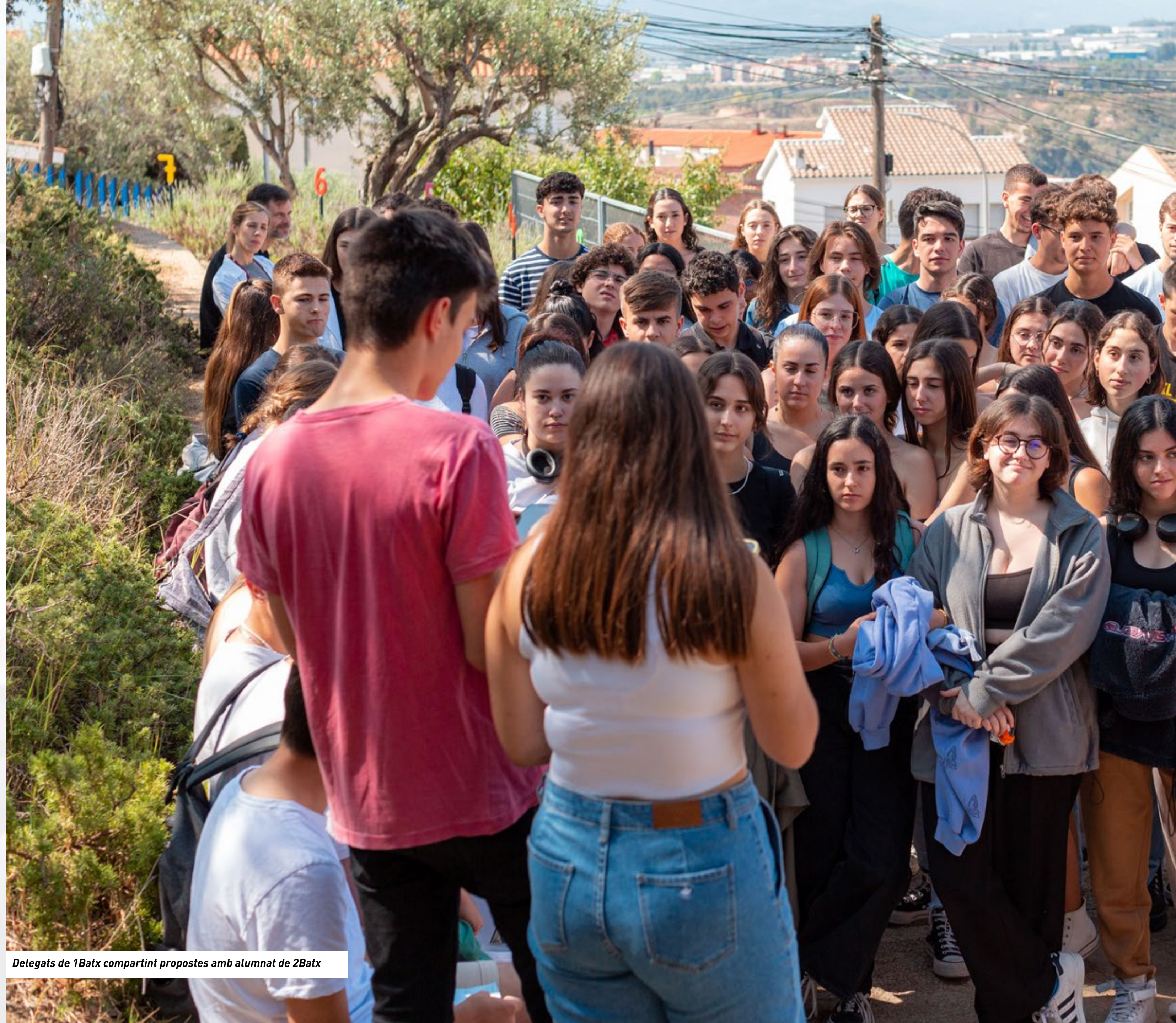
Delegats de 1Batx compartint propostes amb alumnat de 2Batx

És objectiu del claustre seguir amb el projecte i adaptar-lo a les necessitats i inquietuds de l'alumnat durant els pròxims cursos. També volem potenciar-lo dotant als delegats i delegades de tots els cursos d'un espai físic on poder reunir-se i treballar conjuntament amb la resta de delegats i delegades dels altres cursos, així com la realització de dues assemblees generals durant el curs gestionades pel mateix alumnat on es puguin prendre decisions i fer arribar propostes exposades, consensuades i aprovades davant de tot l'alumnat d'ESO i Batxillerat.