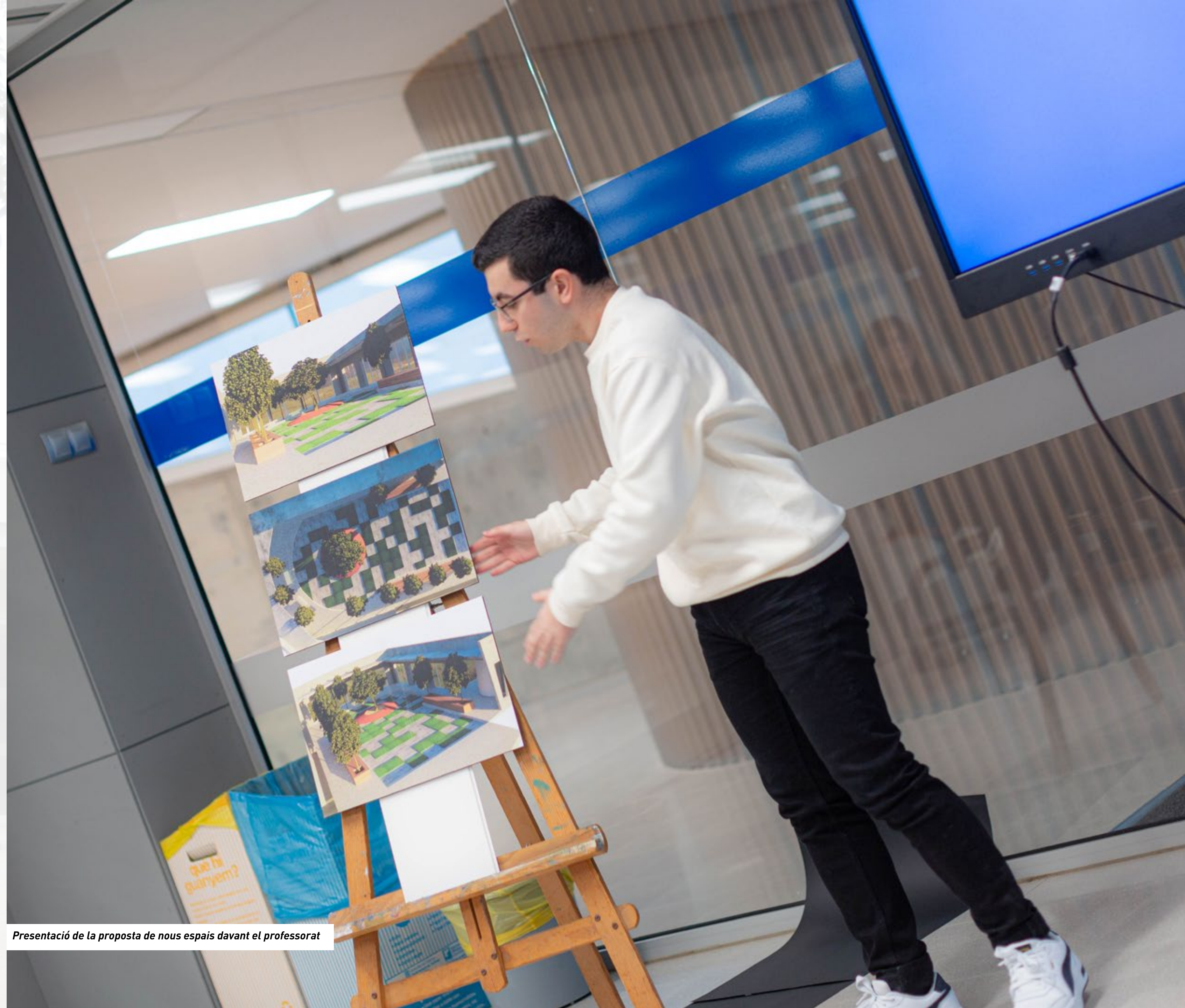
Presentació de la proposta de nous espais davant el professorat

Entenem que per millorar la societat, ens cal comptar amb membres actius, crítics i capaços d'empatitzar amb els seus companys i companyes i els seus pensaments.