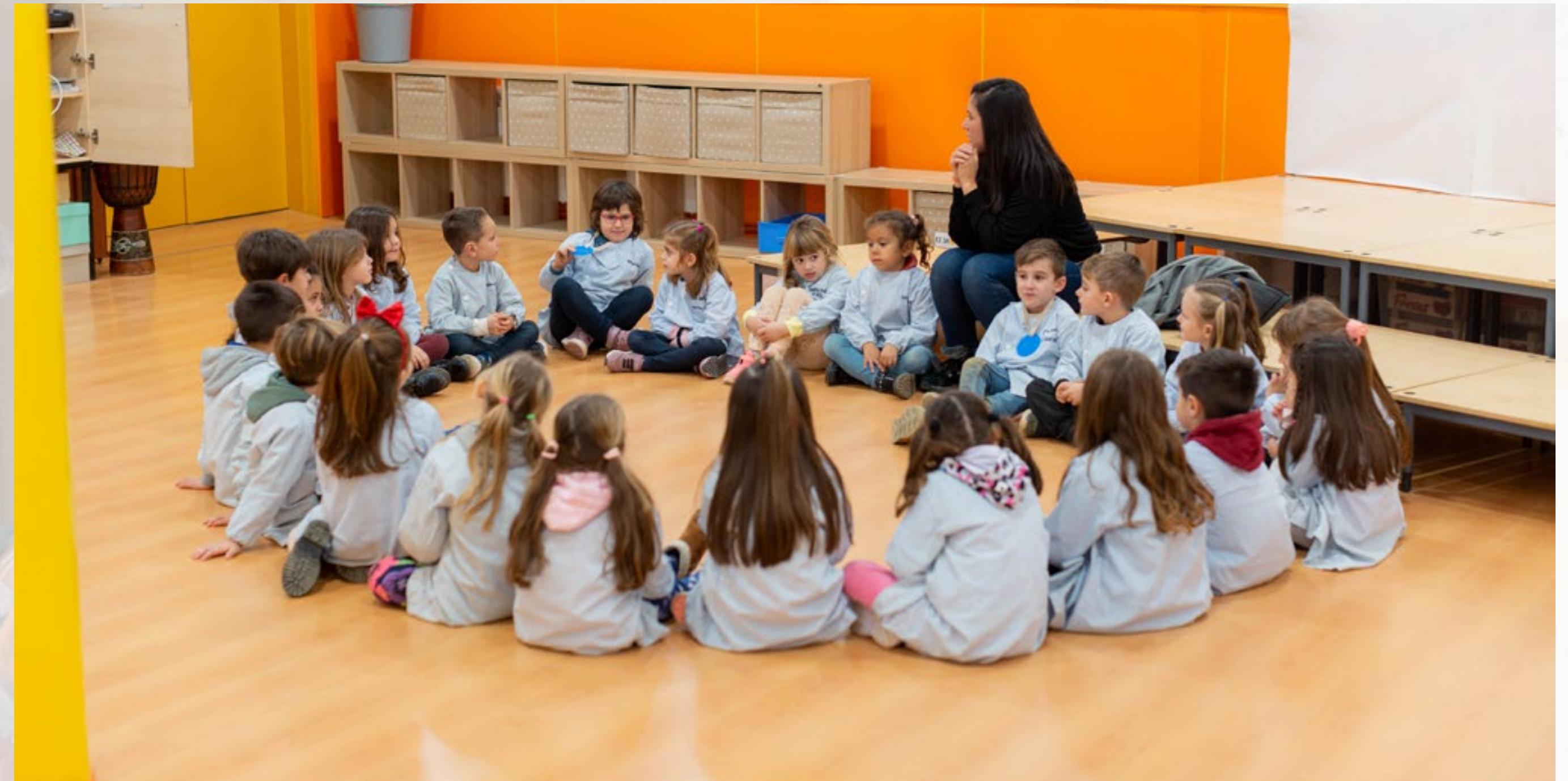
Assemblea setmanal EI 4anys

Assemblees setmanals. Des d'EI3 anys fins a 2n Batxillerat es dedica una hora setmanal a l'espai d'assemblea a cada grup. Un espai on es gestionen situacions, conflictes i neguits del grup amb l'adult de referència com en la figura de moderació. No es resolen cap dels conflictes o neguits exposats, sinó que s'exposen i es fan propostes de millora que cal posar en pràctica durant la setmana per tal de valorar-ne l'efectivitat la setmana vinent. En aquests espais, l'alumnat posa en pràctica l'escolta activa, el respecte dels torns de paraula, la participació activa de cara a la millora i l'empatia de cara a les situacions viscudes pels companys i companyes. A EI i EP, aquesta hora respon a la distribució horària de les hores de gestió autònoma, i a ESO i Batxillerat es dedica l'hora de tutoria a aquest efecte, alhora que es treballen la resta d'eixos establerts en el Pla d'Acció Tutorial (orientació acadèmica, creixement personal i autoconeixement, implicació social).