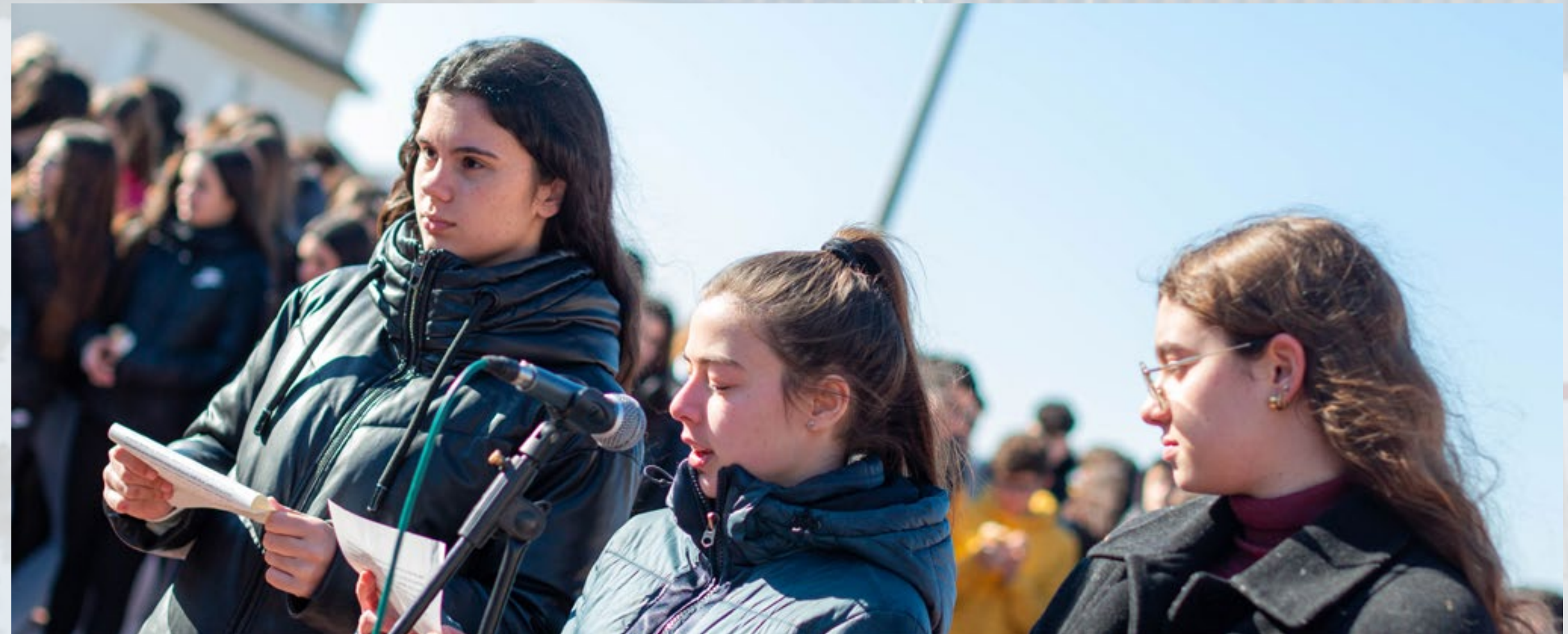
Imatges comissió 8M