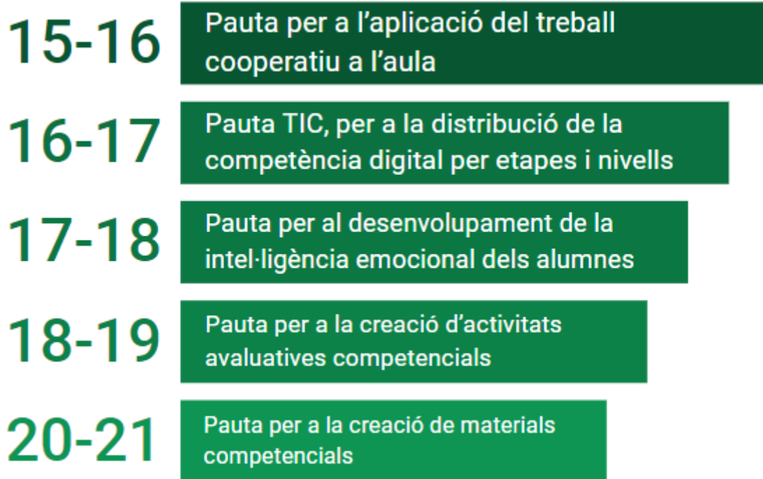
Figura 2. Pautes de treball redactades i implementades. Extret de la pàgina web creada per a la ordenació dels processos de transformació educativa a l'escola Ipse: https://sites.google.com/escolaipse.net/ipseimpulsat/impulsat

dels mateixos, creat consensuadament amb tota la comunitat educativa a l'inici de tot el procés.