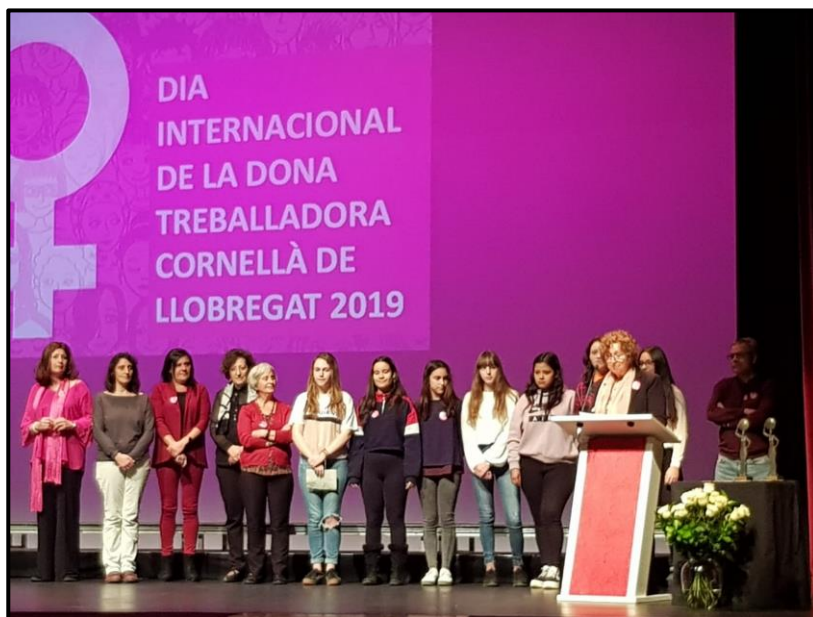
Premi coeducació, auditori de Cornellà, 8 març 2019.