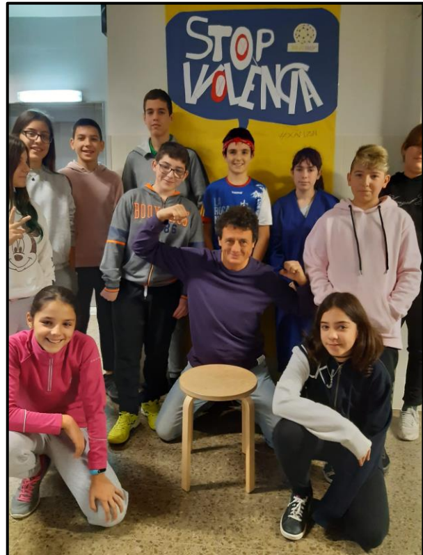
Photocall 25 novembre 2019, dia contra la violència de gènere.