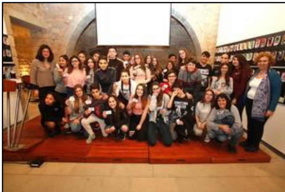
Lliurament carnets XAJI. Castell de Cornellà, 22 novembre 2017.