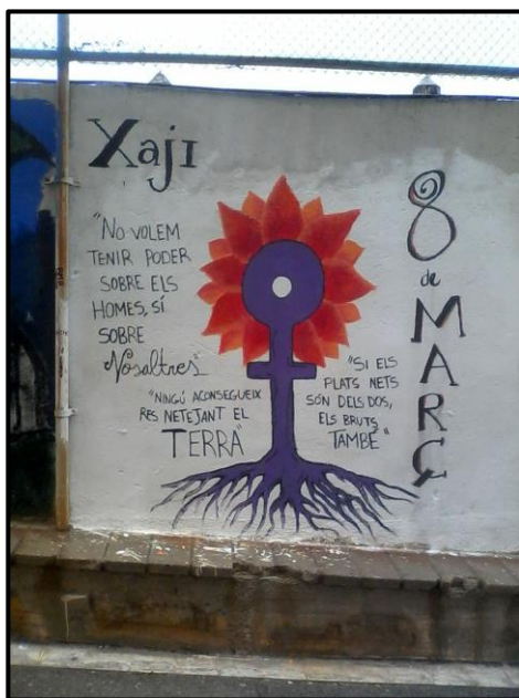
Mural XAJI 2016-2017