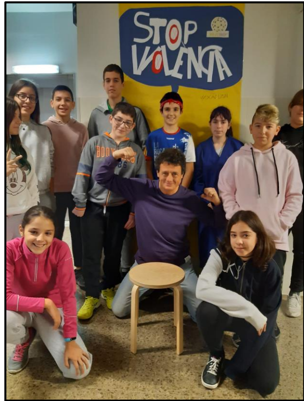
Photocall 25 novembre 2019, dia contra la violència de gènere.