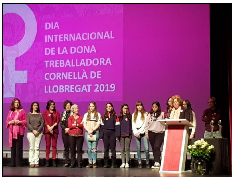
Premi coeducació, auditori de Cornellà, 8 març 2019.